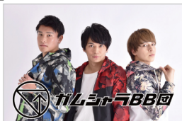
「ガムシャラ BB 団」